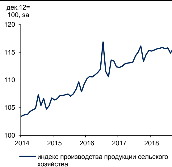
Рис. 2. Сельское хозяйство в сентябре частично отыграло августовское падение