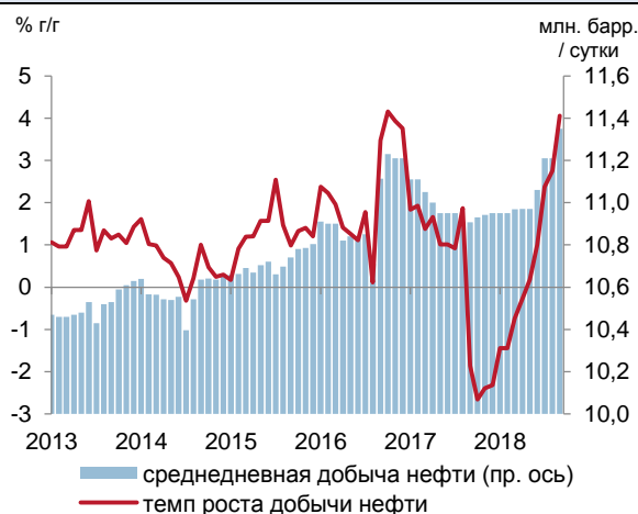
Рис. 4. Добыча нефти в сентябре обновила постсоветский максимум