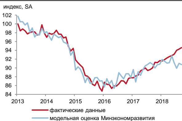
Рис. 1. Индикатор инвестиционной активности МЭР VS инвестиции в основной капитал