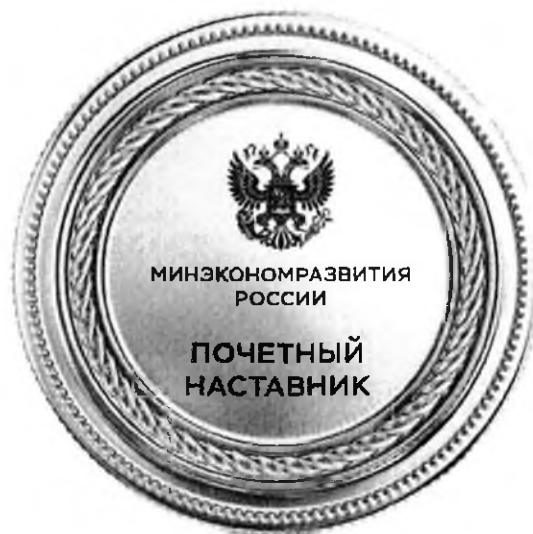
Рисунок ведомственного знака отличия Министерства экономического развития Российской Федерации «Почетный наставник Министерства экономического развития Российской Федерации»

Приложение № 3 к приказу Минэкономразвития России от « 28 » 04 № 2617