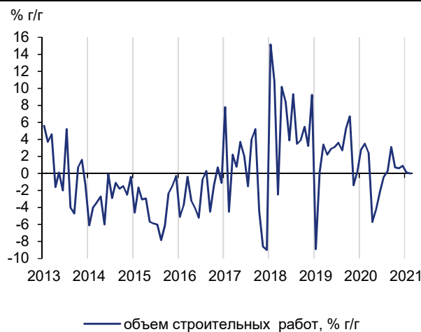
Рис. 2. Объем строительных работ сохранился на уровне прошлого года